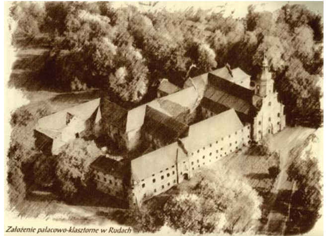
Założenie pałacowo-klasztorne w Rudach

Cystersi byli zakonem kolonizującym, zgodnie z przyjętą zasadą, obszary słabo zaludnione i słabo wykorzystane gospodarczo. Przekazane im tereny przekształcali tak, by prowadzona tam gospodarka zapewniała im proste utrzymanie. Początkowo, ściśle przestrzegając reguły ubóstwa, zabezpieczali oni swoje potrzeby na niezbędnym do przeżycia poziomie (okres pierwszy), później jednak z różnych względów poważnie wzrósł zarówno zakres świadczeń na rzecz państwa i władców – szczególnie prowadzących wojny, jak i inwestycji oraz konsumpcji własnej. Skutki poczynań gospodarczych obciążały wówczas znacznie środowisko przyrodnicze (okres drugi). Granicę między obydwojma okresami (charakteryzującą się zmianą mentalności, kierunków i zakresu działań) potwierdza wyłonienie się w XVII w. z zakonu cystersów odrębnego zakonu – trapistów. Tak jak ich protoplaści, odłączyli się oni od zakonu macierzystego na fali powrotu do surowej reguły św. Benedykta z Nursji. Prześledzenie zmian ekonomicznych przełomu XVI i XVII w. w klasztorach zakonu cystersów oraz