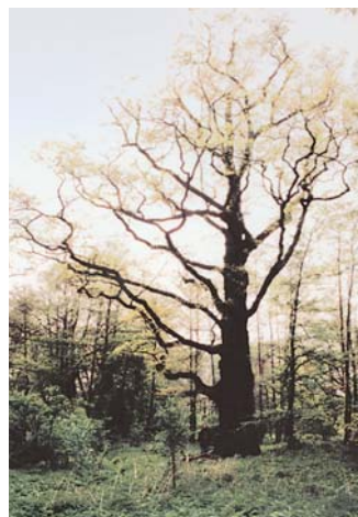
Dąb pod Brantolką