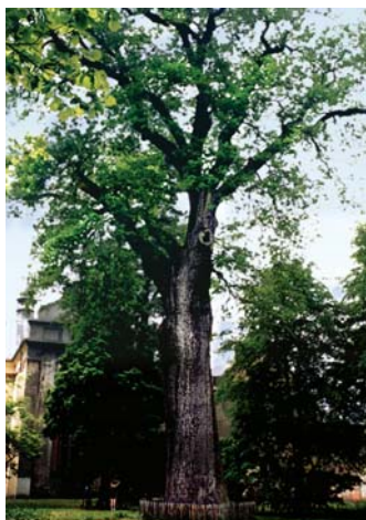
Pomnikowy dąb przy kościele w Rudach

W 1113 roku do zakonu cystersów wstąpił późniejszy święty – Bernard z Fontaine. To on właśnie spowodował duże zainteresowanie nowym zakonem, co zaowocowało wielkim przyrostem powołań. Charakteryzując zakon cystersów odrzucających powszechne wówczas, jak się zdaje, zainteresowania konsumpcyjne, mówił: „W oczach świata