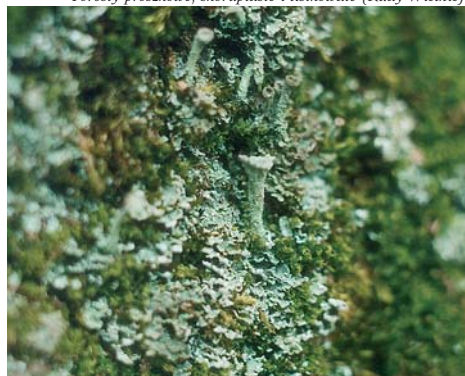
Porosty proskowate, skorupiaste i listkowate (Rudy Wielkie)